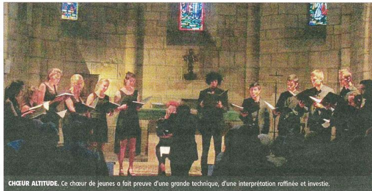
CHŒUR ALTITUDE. Ce chœur de jeunes a fait preuve d'une grande technique, d'une interprétation raffinée et investie.

Le festival de musique ancienne a ouvert samedi à l'église Saint-Jean par un récital donné par le chœur Altitude, sous la direction de Cyprien Sadek.