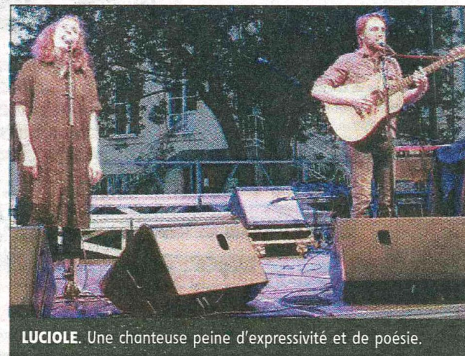
LUCIOLE. Une chanteuse pleine d'expressivité et de poésie.

(*) Dans le cadre du programme culturel de la municipalité.