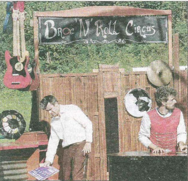
DÉCALÉ. Univers à l'esprit cabaret et scénographie vintage.

Après Aydat, La Roche-Noire, Olloix, et La Sauvetat, la cinquième des Scènes d'une nuit d'été organisées par Mond'Arverne Communauté (*) aura lieu à Vic-le-Comte, mardi 8 août à 19 h 30, au parc Montcervier.