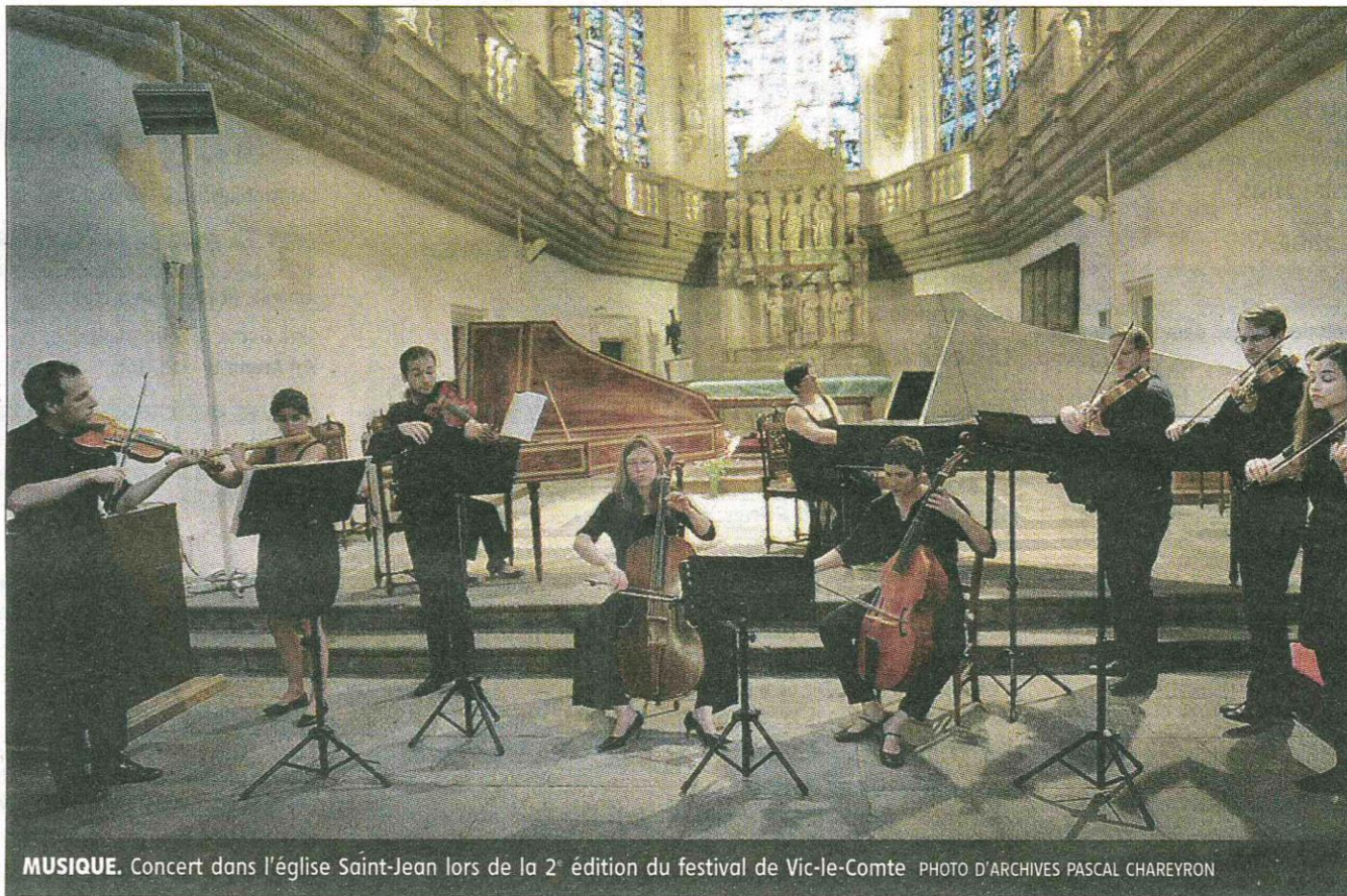
MUSIQUE. Concert dans l'église Saint-Jean lors de la 2 e édition du festival de Vic-le-Comte

Pratique. Renseignements au 06.15.82.03.40 ou 04.73.69.02.12 ; festival.musiqueancienne@gmail.com